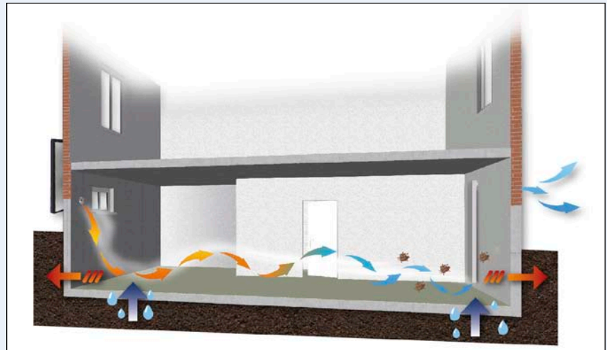
Bild 1: Der Luftkollektor arbeitet autark. Eine Absaugeinrichtung zieht die feuchte Luft aus dem Keller.

Abhilfe gegen diesen unangenehmen Zustand im Keller bietet der dänische Luftkollektorspezialist SolarVenti mit einem speziellen Solarluftkollektorsystem an. Das System bekämpft das Problem mit doppelter Wirkung: durch die warme Luft, die es erzeugt, und den hohen Luftdurchsatz mit dem es die feuchte Luft aus dem Keller treibt.