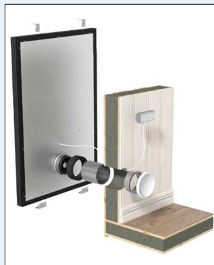
Bild 5: Wandmontage des SolarVenti mit Mauerdurchführung und Einblasventil