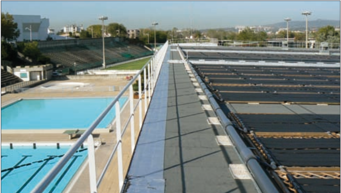
Bild 1: Freibad mit Absorberheizsystem in Villeurbanne, Frankreich

Wie bereits im Heft 05/08 vorgestellt ist es das Ziel der SOLPOOL Kampagne, Besitzern und Betreibern von Freibädern und Installateuren die Potentiale der Solarenergienutzung zur Beheizung von Schwimmbädern näher zu bringen. Das von der DGS koordinierte Projekt wird parallel in 7 europäischen Ländern (Deutschland, Tschechien, Griechenland, Ungarn, Italien, Slowenien und Frankreich) durchgeführt.