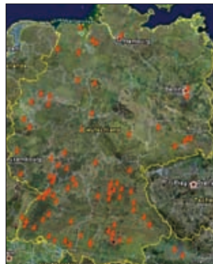
Wachsende Gemeinschaft: RAL Mitgliedsunternehmen in Deutschland und Österreich

wusstsein der Unternehmen für die verschiedenen von der Errichtung von Solaranlagen betroffenen Gewerke.