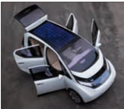
Bild 5: Eine nahezu perfekte Lösung bietet der Pininfarina BO. In einem breiten Ladekabelfach, das von den Seiten als auch von vorne optimal zu erreichen ist, wartet das bereits angeschlossene Ladekabel griffbereit in ergonomischer Höhe.