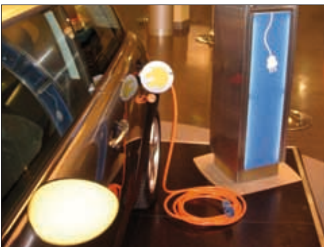
Bild 3: Der BMW Mini E bedarf eines extrem langen Ladekabels, weil die Ladebuchse unter dem Tankdeckel hinten links sitzt.

Da der BMW Mini seinen Tankdeckel links hinten hat, ist dort auch die Strombuchse gelandet. Daraus ergibt sich automatisch die Notwendigkeit zu extrem langen Kabeln (bis 7 Meter), sofern man an üblichen Ladepunkten Anschluss finden will. Aufgrund der hohen Ladeleistung des Systems war BMW auch zu einem sehr dicken Kabel gezwungen. Dieses ist zu schwer um in der Luft zu „schweben“ und wird folglich meistens