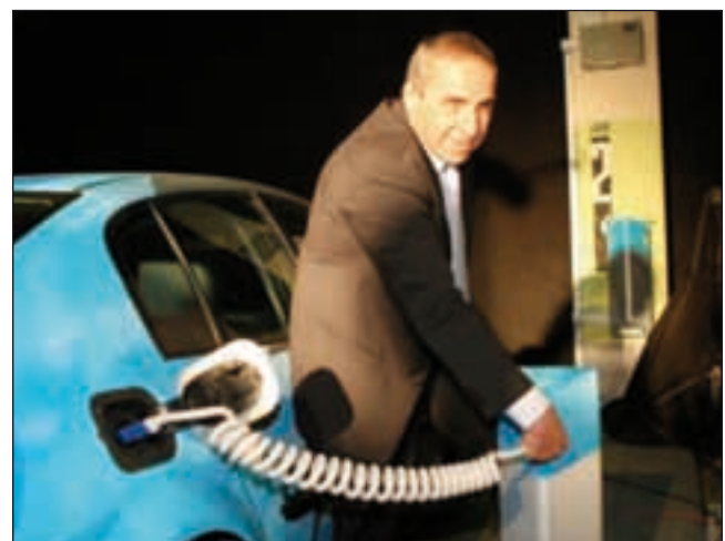
Bild 4: Better Place liefert zwar ein schönes Bild für die Presse, doch aus ergonomischer Sicht ist das gezeigte System nicht durchdacht.