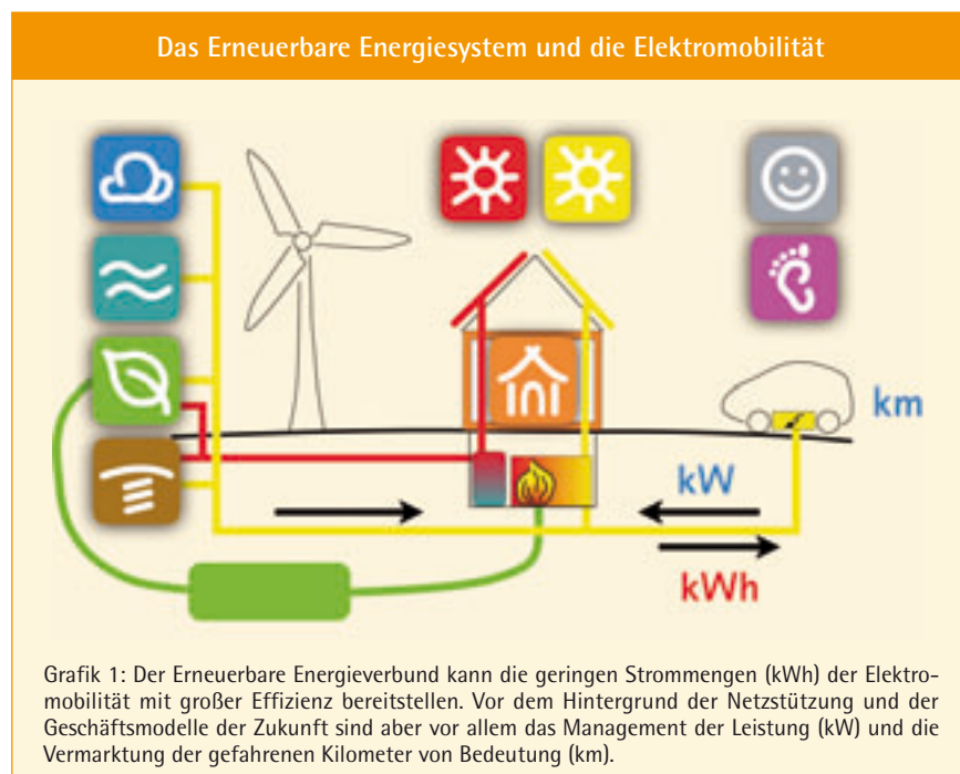
Grafik 1: Der Erneuerbare Energieverbund kann die geringen Strommengen (kWh) der Elektromobilität mit großer Effizienz bereitstellen. Vor dem Hintergrund der Netzstützung und der Geschäftsmodelle der Zukunft sind aber vor allem das Management der Leistung (kW) und die Vermarktung der gefahrenen Kilometer von Bedeutung (km).

Das Konzept des „Tankens“ beschreibt einen Vorgang, bei dem der Autobesitzer feststellt, dass der Tank des Autos leer wird. Man fährt dann gezielt zu einer Tankstelle mit dem vorrangigen Ziel, den Tank aufzufüllen. Dies ist eine