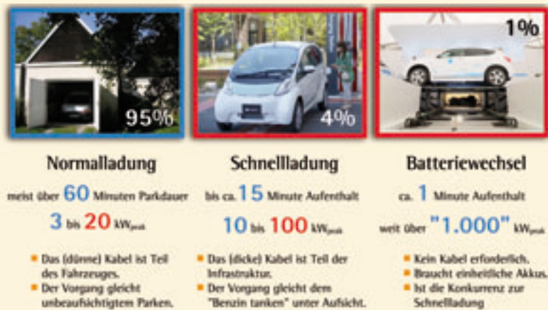
Grafik 3: Nur die Normalladung kann als „Netzintegration“ bezeichnet werden, denn nur in diesem Fall ist eine zeitliche Verlagerung der Energieübertragung möglich. Die eher selten erforderlichen Systeme für die Schnellladung und den Batteriewechsel fallen in die Kategorie des „Strom tankens“.