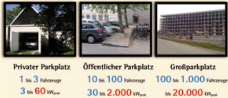
Grafik 2: Die verschiedenen Standorttypen führen zu einer unterschiedlich hohen Maximalbelastung der Stromnetze. Doch bereits der vermeintlich einfachste Fall, der private Parkplatz, zwingt bereits zu Lösungen für intelligentes Laden.