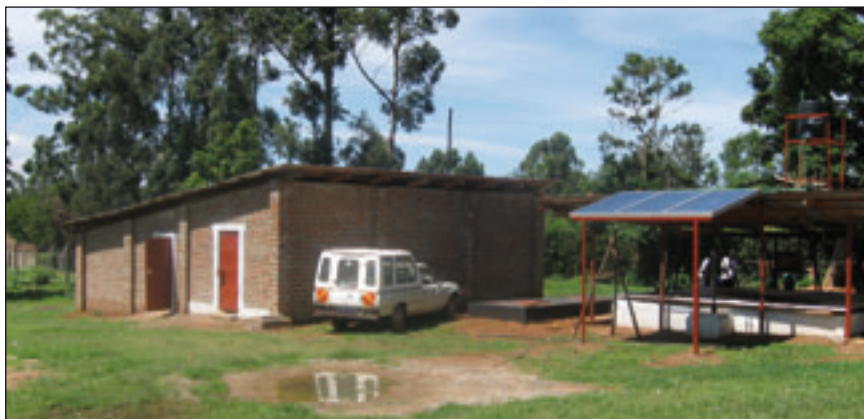
Beispiele aus dem Projekt