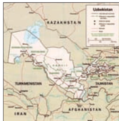
Bild 2: Zentralasiatische Elektrizitätsverbund, Schaltzentrale in Taschkent