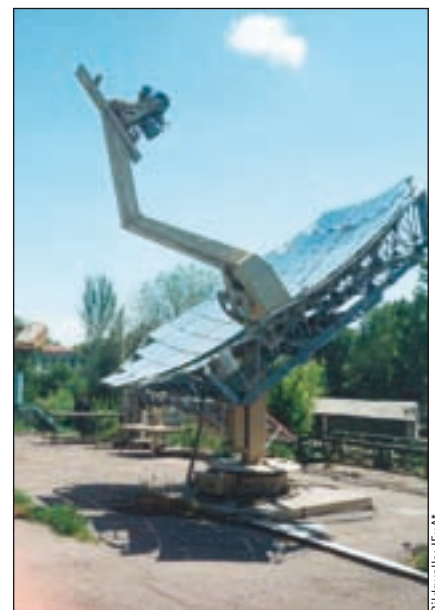
Bild 4: 1 kW-DISH-Sterling-Anlage, Durchmesser des Solar-Konzentrator = 5 m