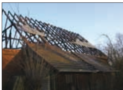
Feuer zerstört PV-Anlage

Derzeit schlägt die Diskussion um Photovoltaikanlagen und die Weigerung einiger Feuerwehren bei dem Vorhandensein einer Photovoltaikanlage Brände zu löschen, auch wenn diese nicht von der Photovoltaikanlage ausgehen, hohe mediale Wellen. Hintergrund der Diskussion ist die Tatsache, dass Photovoltaikanlagen mit in Reihe geschalteten Modulen bei Lichteinfall unter Strom stehen. Sie können zwar vom Netz genommen werden, nicht aber spannungsfrei geschaltet werden, da die Leerlaufspannung anliegt.