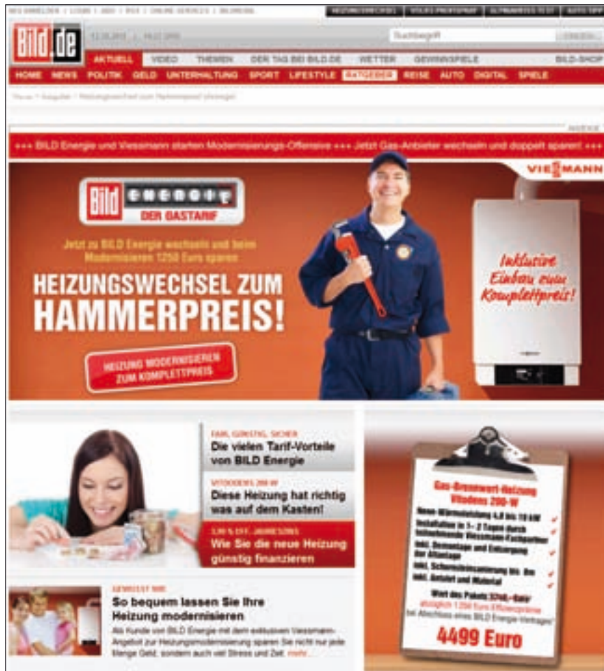
Bild 1: BILD Sprüche statt Argumente – Solartycoon J.R. Ewing hat das nicht nötig

DAS ABLEBEN EINER ÜBERHOLTEN TECHNOLOGIE VERZÖGERT SICH