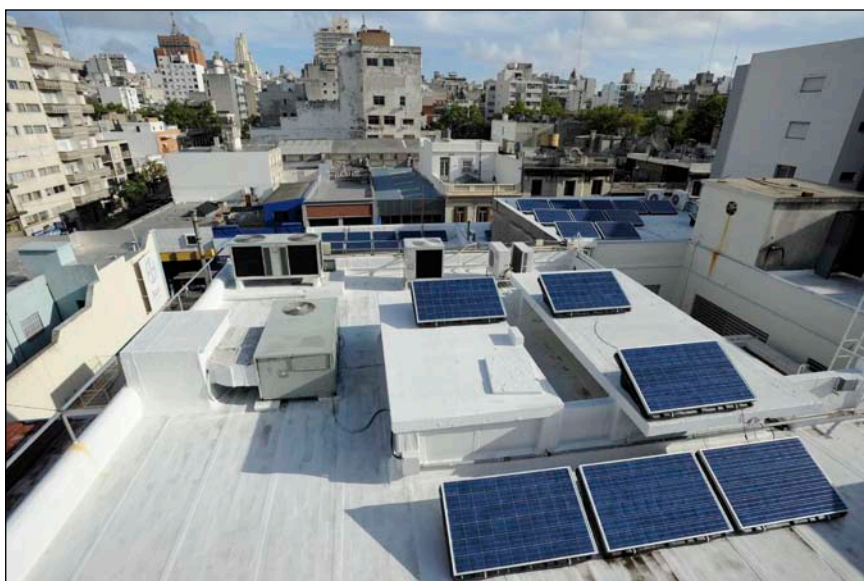
Bild 5: Photovoltaikanlage auf dem Bayer Buerogebäude in Montevideo