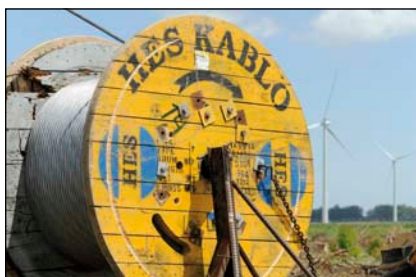
Bild 2: Anschluss des UTE Windparks Kentilux an das Stromnetz der UTE (Ciudad de Plata)

gut wie er. Nach langen Jahren des Planens, Messens und auch Wartens fiebert er jetzt dem baldigen Bau der ersten von ihm entwickelten Windparks entgegen. Hat sich doch die uruguayische Regierung erst vor Kurzem zum mittelfristigen Umbau der Energiewirtschaft – hin zu den Erneuerbaren Energien – bekannt: Bis 2015 soll die Hälfte des Primärenergieverbrauchs aus Wind, Wasser, Biomasse und Sonne stammen. Bei diesem Ziel kommt den Uruguayern sicherlich zugu-