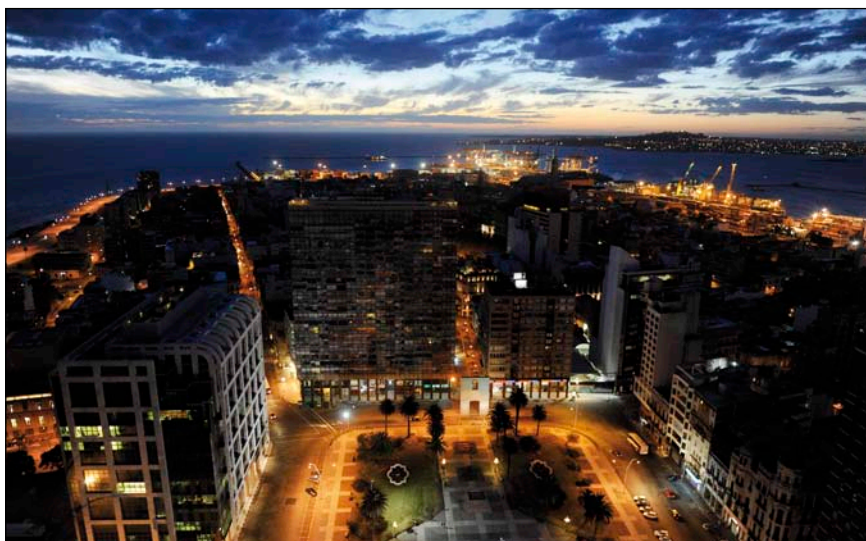
Bild 1: Blick vom Hochhaus Palacio Salvo am Plaza de Independencia auf den Hafen am Rio del la Plata (Montevideo)

URUGUAY WILL VORREITER BEI DEN ERNEUERBAREN ENERGIEN FÜR GANZ SÜDAMERIKA SEIN. DER DERZEITIGE WIRTSCHAFTLICHE ERFOLG GIBT AUCH DEM UMBAU DER ENERGIEWIRTSCHAFT EINEN SCHUB UND WIRD DAMIT ZUM LABOR FÜR LATEINAMERIKA