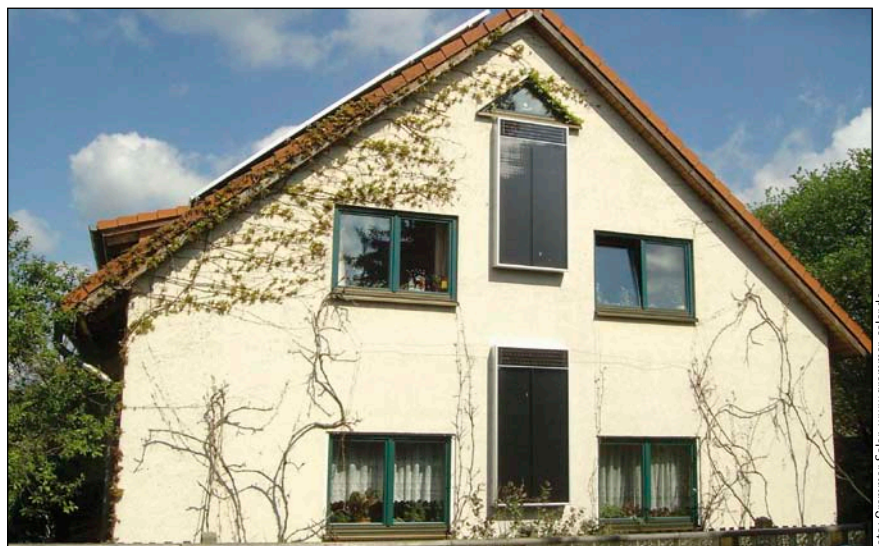
Bild 1: Wohnhaus bei Leipzig – dezentrale Plusenergielüftung mit zwei Twinsolar 1.3 Compact

Oft werden energetisch wenig vorteilhafte Lösungen installiert, die die energetischen Sanierung teilweise konterkarieren, wie permanent geöffnete