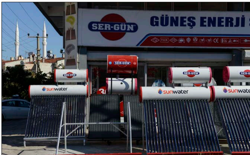
Bild 2: Verkauf von Sonnenkollektoren und Photovoltaik bei Güneş Enerji in Bergama

Jedoch geht es beim Ausbau der Stromerzeugungskapazitäten in der Türkei bei Weitem nicht nur um die Windenergie. So versuchen die Türken mit aller Macht, nicht zuletzt auch wegen der politisch äußerst prekären Lage in den Nachbarstaaten, sich ihrer großen Abhängigkeit von Energieimporten zu entledigen: Es sollen Geothermie-Kraftwerke mit einer Kapazität von 600 MW entstehen, 3.000 MW Solarenergie installiert und die schon heute starke Wasserkraft (die bislang rund ein Viertel der Stromversorgung sicherstellt) durch 500 zusätzliche Wasserkraftwerke auf insgesamt 36.000 MW Leistung erweitert werden. Auch Biogas-Projekte in den Bereichen Viehwirtschaft und Abfallbereich sind im Bau bzw. geplant. Zugleich aber, parallel zum Ausbau der Erneuerbaren, postuliert