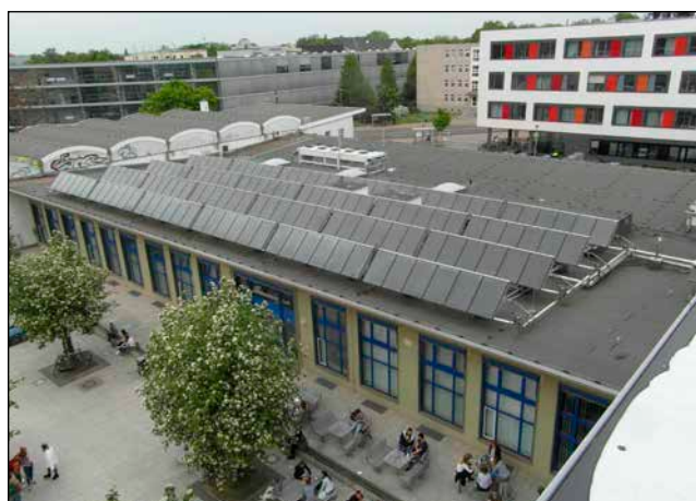
Bild 4: Das Kollektorfeld auf dem Rechenzentrum (180 m 2 ) soll demnächst eine Absorptionswärmepumpe antreiben.