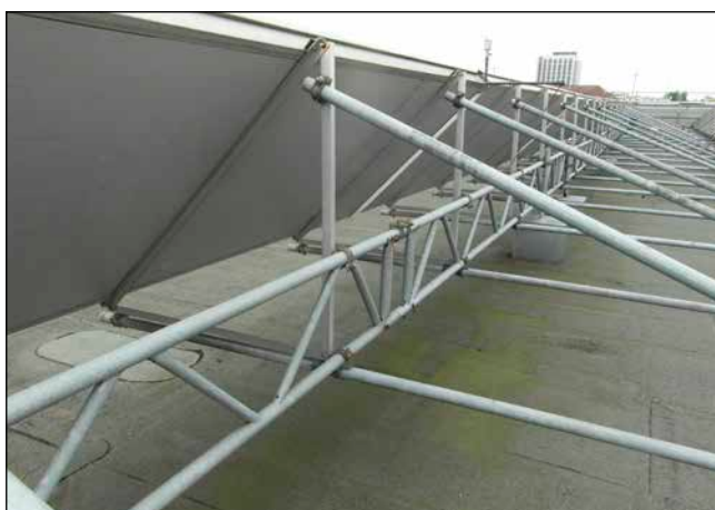
Bild 3: Die Leichtgewicht-Tragkonstruktion aus Gerüstbauteilen zeigt sich unverwüstlich und korrosionsresistent.

Ein Blick in den Schaltschrank zeigt die alte Messtechnik mit Windows 95-Rechner die ebenso wie die große Anzeigetafel, ein Bestandteil des Förderprogrammes, nicht mehr weiter betrieben werden konnte. Doch der alte Aquametro Wärmemengenzähler verrichtet hier seit 19 Betriebsjahren seinen Dienst und zeigt 4.962.652 kWh (Bild 2). Das sind mit 261 MWh/a ca. 10 % weniger als der garantierte Ertrag (aber 90% Verfügbarkeit) und spezifisch mit 397 kWh/m 2 – über diesen langen Zeitraum und trotz Revisions- und Stillstandszeiten sowie Stilllegung einer Kollektorreihe – ein bemerkenswertes Ergebnis!