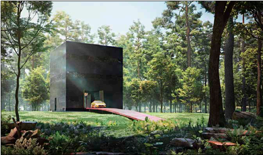
Bild 1: Aussenansicht der „Black Villa“: Die Fassade des autarken Wohnhauses ist mit einheitlichen schwarzen Photovoltaik-Paneelen verkleidet.