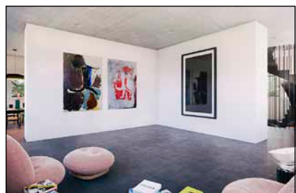
Bild 2: Wohnebene im 1. OG mit dem „Kreuz“ in der Mitte, der die Räume gliedert.

Black Villa ist von einem „Wassergraben“ umgeben, ähnlich einer Burg. Der Graben ist in diesem Fall ein Schwimmbad, in dem die Einwohner Ehrenrunden rund um das Haus drehen. Ähnlich einem suprematistischen Werk sind die einzelnen Elemente in Bewegung: eine Strasse durchdringt das Gebäude und wird zum Vorhof mit hohen verschliessbaren Toren. Von hier aus gelangt der Einwohner in eine verglaste Eingangszone. Im Erdgeschoss ist eine Lounge für spontane Empfänge bzw. Poolbar konzipiert. 1. OG ist die Wohnzone mit angrenzenden Galerien, die als Salon dienen können. 2.