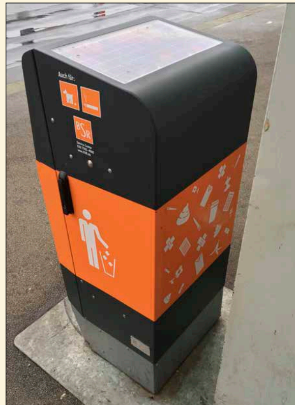
Das neue ministerielle Ablagesystem

Immer wieder bekommt die DGS Post von Bundesministerien. Besonders eifrig zeigt sich dabei das Bundeswirtschaftsministerium mit seiner Fülle an Gesetzesvorschlägen, immer wieder dabei: eine der x'ten Novellen des EEG. Im Rahmen der Verbändeanhörung werden auch wir oft gefragt, was wir von alledem halten. Klar, es ist uns natürlich bewusst, dass wir beim BMWi über keinen Lobbystatus verfügen, aber unbelehrbar wie wir nun manchmal sind, schreiben wir meist brav unsere Stellungnahmen und Änderungsvorschläge.