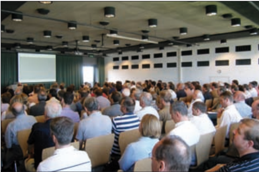
Bild 1: Ein brandaktuelles Thema: Feuerwehreinsätze bei Gebäuden mit Photovoltaikanlagen

Fachforum am 17. Mai im Bauzentrum München