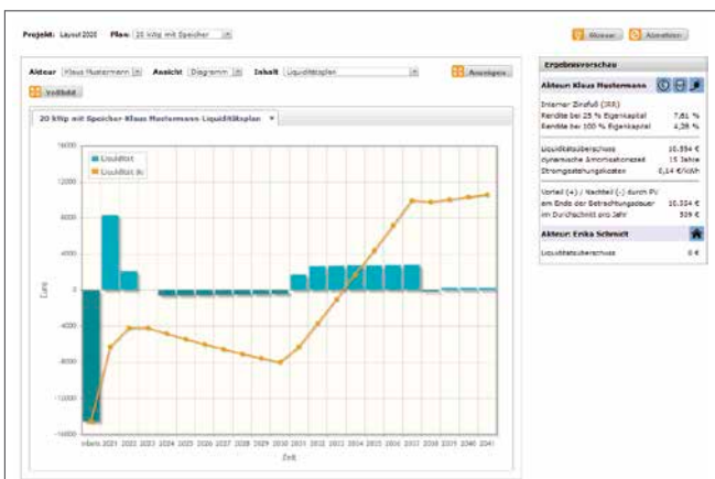
Screenshot Diagramme & Tabelle, Liquiditätsplan Investor